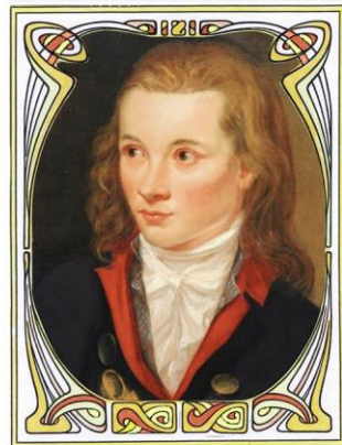
Sprichwörter und Aphorismen in ihrer Bedeutung für uns