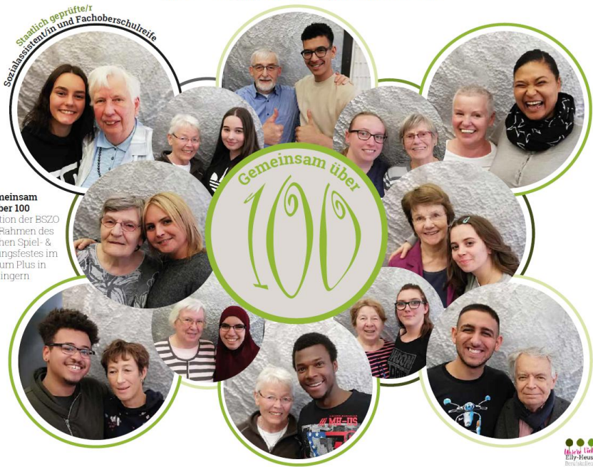
Spiel & Bewegungsnachmittag im Zentrum Plus

Ein Spiel- und Bewegungsnachmittag vom Frühjahr 2019 im Zentrum plus mit Schülerinnen und Schülern der Elly-Heuss-Kapp-Schule.